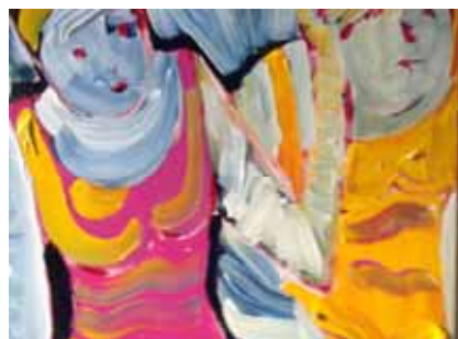
Détails : Baigneuses 4, © Andrée Lévesque

ANDRÉE (GLUZMAN) LÉVESQUE Arrêt du temps