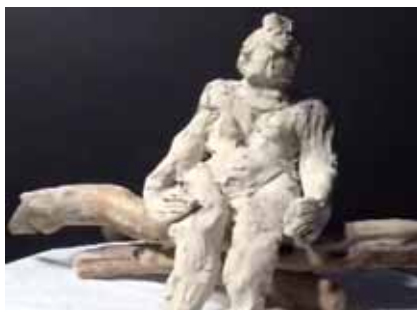
Détails : Bois de grève 2, © Lévesque Hamel