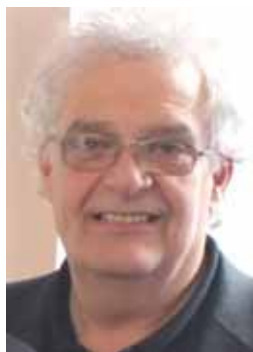
MICHEL COTÉ PRÉFET

Pour cette troisième exposition, nous vous proposons un voyage avec une artiste accomplie. Madame Andrée Lévesque a exploré la sculpture avec l'argile et créé de nouvelles peintures sous le thème des baigneuses, le tout accompagné de dessins. L'exposition démontre ainsi l'évolution de son art à travers différents médiums. Ces œuvres sont présentées de manière à occuper tout l'espace d'exposition de la MRC de La Mitis, une première.