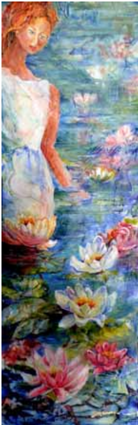
NYPHE AUX YEUX DE CIEL ET DE MER

2010 Acrylique Dimension: 12" x 36" Prix de vente: 675 $ © Ghislaine Marmen