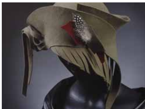
Détails de Preamble, © Jean Albert