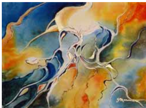
Rêve de NEPTUNE, © Ghislaine Marmen